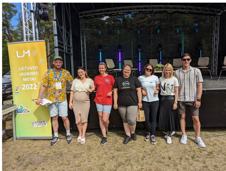
Diskusijos apie ES galimybes jaunimui dalyviai