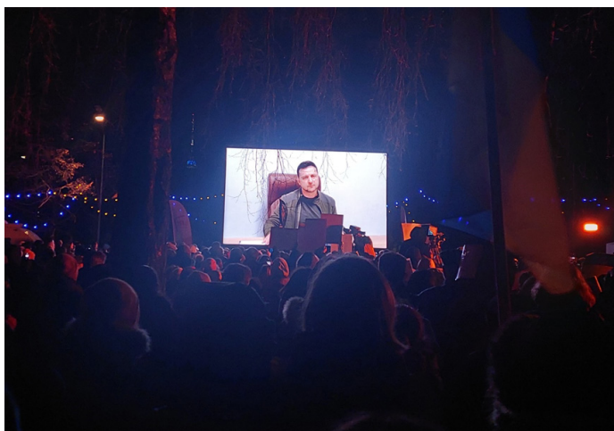
Ukrainos prezidento Volodymyro Zelenskio kreipimasis į europiečius, Ukrainos palaikymo akcija, 2022 m. kovo 4 d., Vilnius.

Akcijos transliacijos nuoroda: https://www.youtube.com/watch?v=wjQ_DAtEDmk